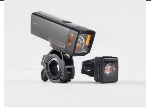
Trek Commuter Pro RT/Flare RT Rechargeable Set

Signed for and on behalf of / Podepsáno za a jménem / Unterzeichnet für und im Namen von / Underskrevet for og på vegne af / Underskrevet for og på vegne af / Puolesta allekirjoittanut / Signé par et au nom de / Firmato a nome e per conto di / Ondertekend voor en namens / Signert for og på vegne av / Podpisano w imieniu / Assinado por e em nome de / Undertecknad för / Podpísané za a v mene: