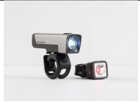
Ion Comp R/Flare R City Set